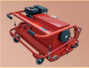
Horquilla de accionamiento abatible, para facilitar el transporte y ahorrar espacio

Alavanca de accionamento dobrável para facilitar o transporte e poupar espaço