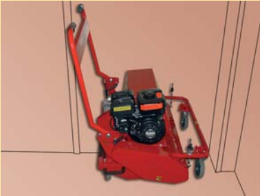
Fácilmente manejable en pasos estrechos

Bandeja filtrante extraível com depósito de sujidade