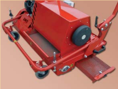
Bandeja filtrante extraíble con depósito de suciedad

Alavanca de accionamento dobrável para facilitar o transporte e poupar espaço